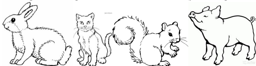
БЕЛКА СВИНЬЯ ЗАЯЦ КОШКА

4. По картинкам определи названия животных (укажи стрелками)